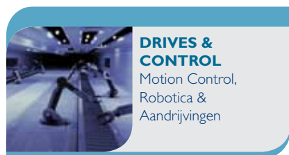
DRIVES & CONTROL Motion Control, Robotica & Aandrijvingen