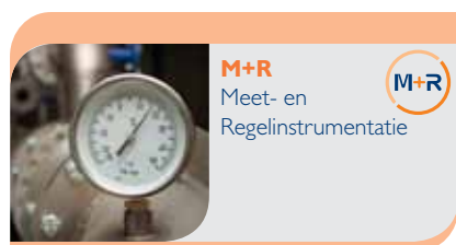
M+R Meet- en Regelinstrumentatie

Aparte technologische accenten die tot één geheel gebundeld worden, vormen een perfecte weerspiegeling van de heersende industriële realiteit. De combinatie van process automation en factory automation resulteert in 4 gespecialiseerde vakbeurzen: