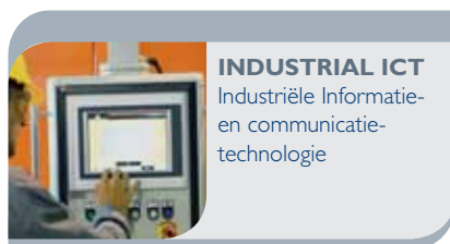
INDUSTRIAL ICT Industriële Informatie- en communicatie- technologie

Alle technische afdelingen die waarde toevoegen, gaande van ontwerp en engineering tot productie, onderhoud en kwaliteitscontrole, krijgen een totaalbeeld van de ontwikkelingen in de verschillende domeinen gepresenteerd. Bovendien kunnen bezoekers duidelijk en snel hun weg vinden in de technologieën en toepassingsmogelijkheden die hun interesse wegdagen.